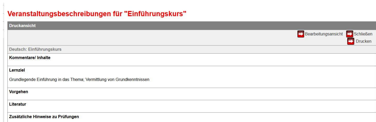
Abbildung 3: Druckansicht

Bitte nach jedem Eintrag speichern. Über den Button „Druckansicht“ können Sie eine Druckversion ansehen und ausdrucken.